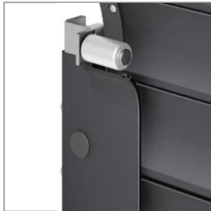
Guide en aluminium avec rouleau de guidage