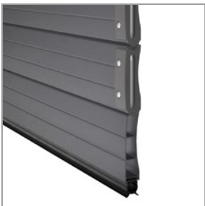
Blindage avec résistance accrue à l'abrasion