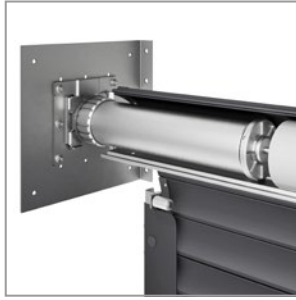
Motorisation tubulaire latérale