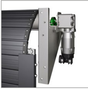
Motorisation latérale avec prise