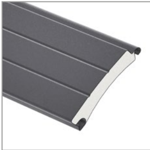
Profilé en aluminium à double paroi, hauteur 100 mm